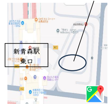
東口 バスロータリー駐車場内