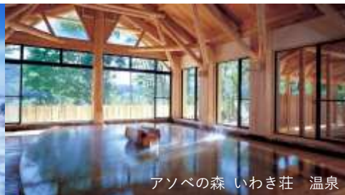
アソベの森 いわき荘 温泉