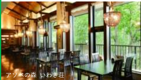
アソベの森 いわき荘